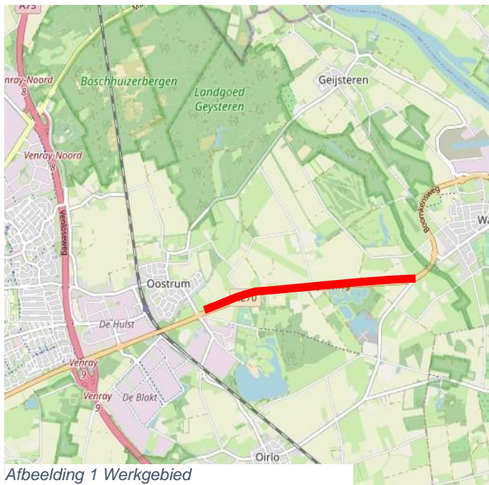
Afbeelding 1 Werkgebied

Wij streven ernaar om de werkzaamheden op doordeweekse dagen uit te voeren, dus van maandag tot en met vrijdag tussen 07:00 uur en 18:00 uur. Uiteraard proberen we de overlast voor u zoveel mogelijk te beperken.