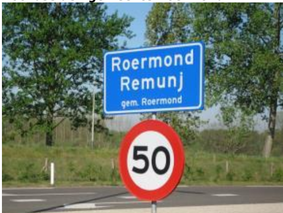
Hoger bord op flespaal