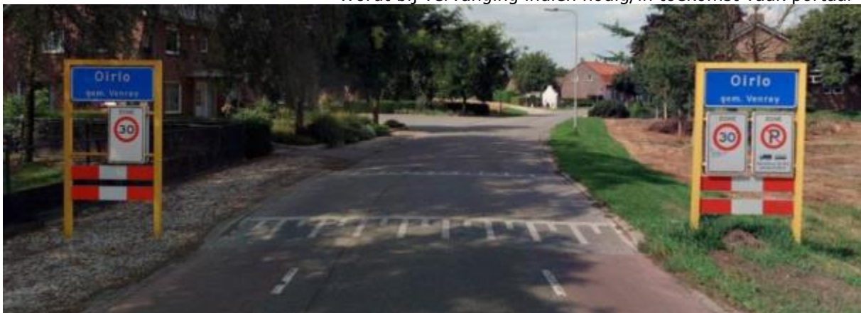
Komborden kerkdorpen. Geen ruimte voor hoger bord. (30 km-zone + parkeerverbod)