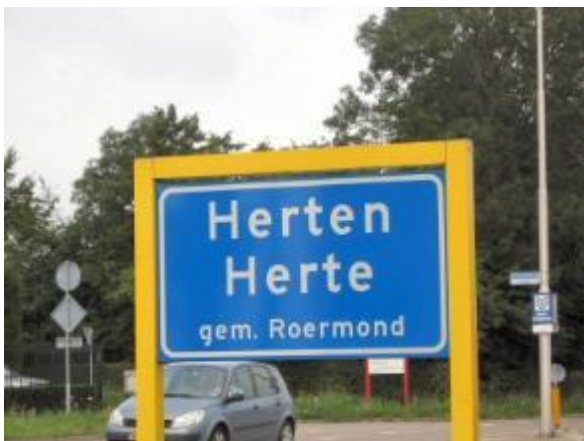
Hogere bord in portaal (ruimte eronder is aanwezig)