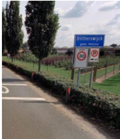
Kombord op flespalen. Meer flexibiliteit, ruimte blijft beperkt Wordt bij vervanging indien nodig/in toekomst vaak portaal