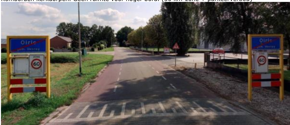
Komportaal kerkdorp, achterzijde