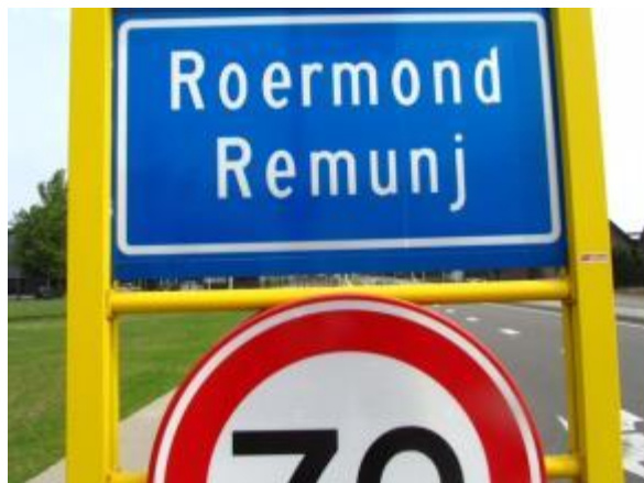
2 regels, zonder gemeentenaam