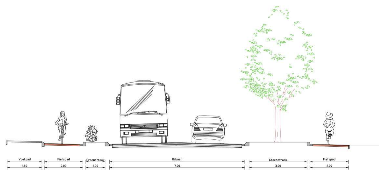
Dwarsprofiel 2 schaal 1:50